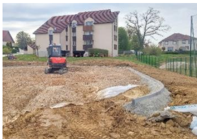
Les différentes étapes de la construction du terrain multi-sport.