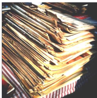
Une action simple, et qui allège vos poubelles !

Les membres de la commission « Info- Com' »